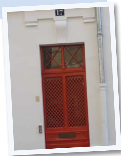
Ouverture du Centre Gutenberg, page 4