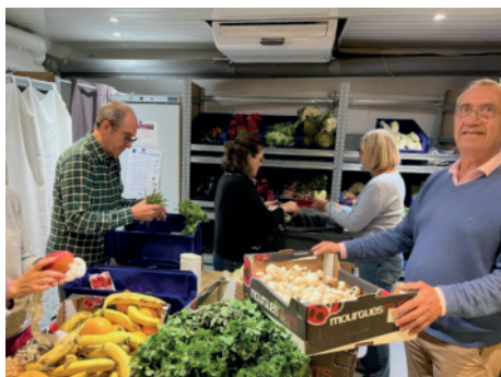
Réassort de produits frais à l'épicerie.

Merci à la Fondation Périol qui soutient le projet. Corot poursuit sa recherche de financements complémentaires pour finaliser les travaux en 2024.